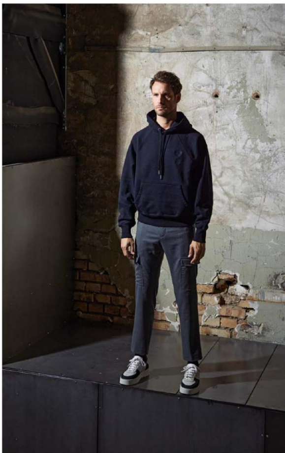
Hoodie AMI PARIS 310.– Hose PT TORINO 299.95 Schuhe AXEL ARIGATO 210.–