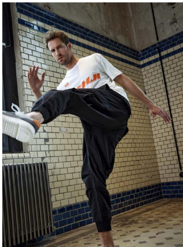
T-Shirt 119.95 Hose 299.95 Beides von Y-3 .

DYNAMIK UND MODERNITÄT: FUNKTION IN ALLTAGSTAUGLICHER, MINIMALISTISCHER FORMENSPRACHE. DER STIL ENTSCHIEDET.