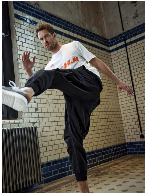
T-Shirt 119.95 Hose 299.95 Beides von Y-3 .

DYNAMIK UND MODERNITÄT: FUNKTION IN ALLTAGSTAUGLICHER, MINIMALISTISCHER FORMENSPRACHE. DER STIL ENTSCHIEDET.